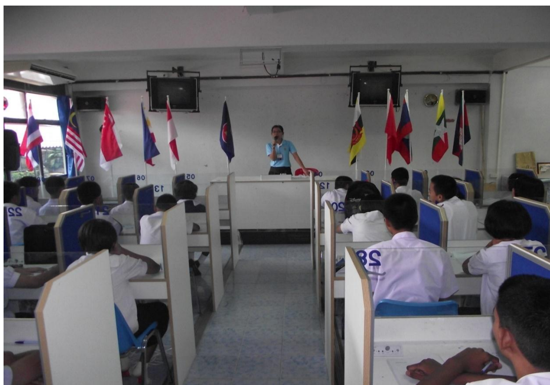
นักเรียนฟังการบรรยายและการอบรมสั่งสอนจากครู