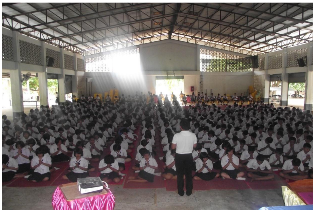
นักเรียนมีความตั้งใจและให้ความร่วมมือในกิจกรรม