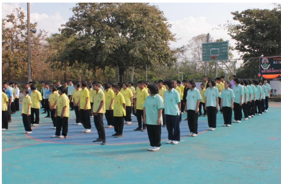
นักกีฬาเข้าแถวเพื่อร่วมพิธีเปิดกิจกรรมการแข่งขันฟุตบอล K.S. CUB