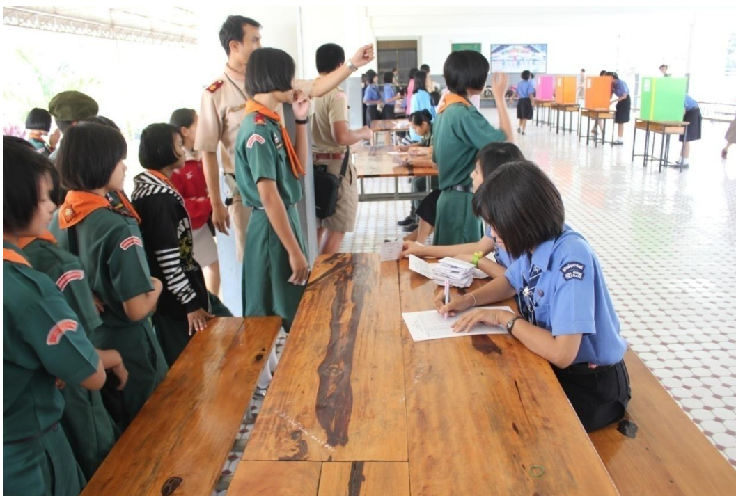
นักเรียนลงทะเบียนเพื่อรับบัตรเลือกตั้งประธานนักเรียน