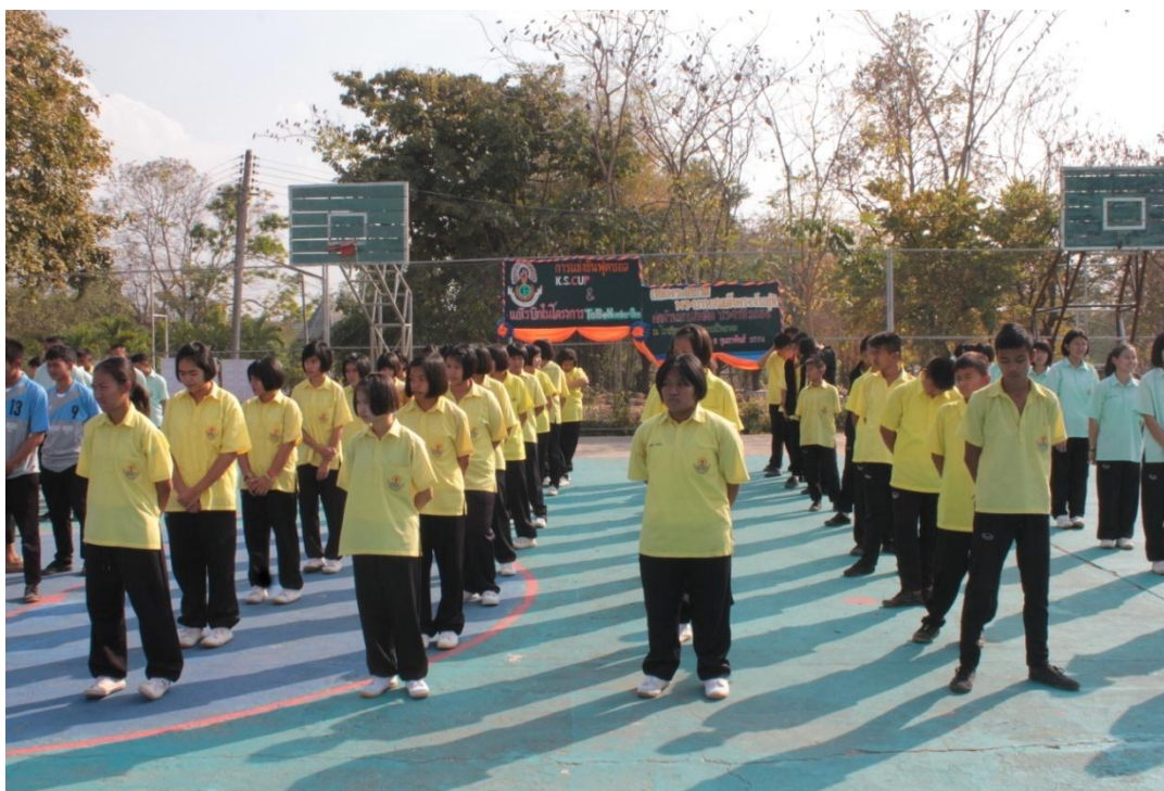
นักกีฬาเข้าแถวเพื่อร่วมพิธีเปิดกิจกรรมการแข่งขันฟุตบอล K.S. CUB