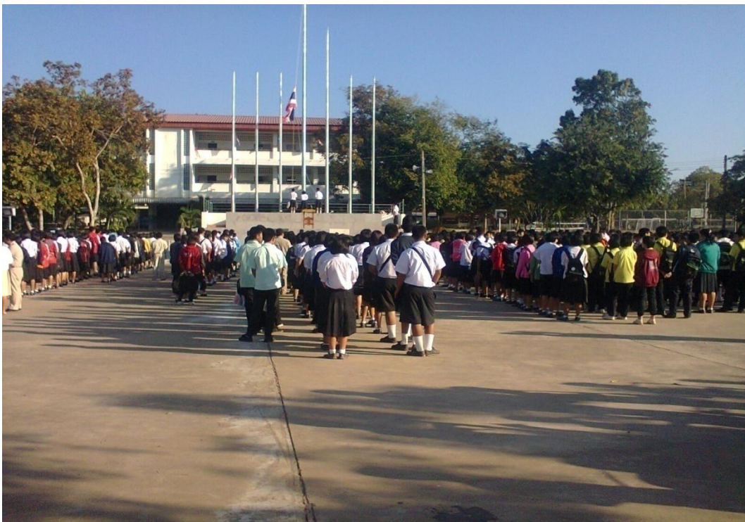
นักเรียนยืนแถวเคารพธงชาติด้วยความเป็นระเบียบเรียบร้อย