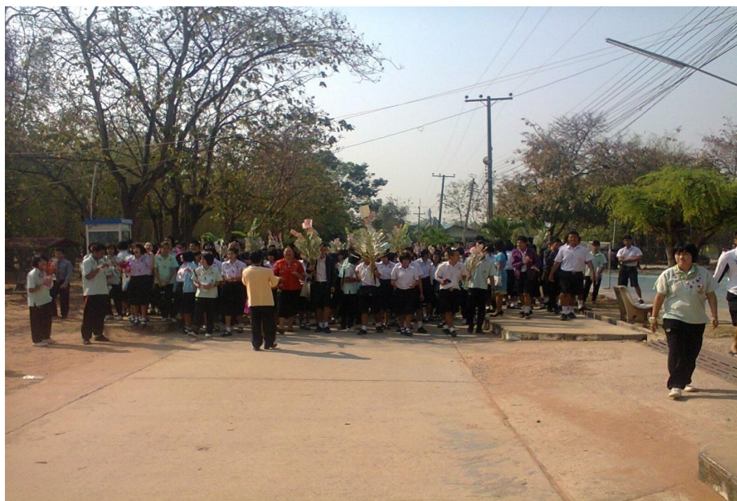
คณะครู คณะกรรมการนักเรียน และนักเรียนทุกห้องร่วมแห่ต้นผ้าป่าเพื่อทอด ถวายที่หอประชุมโรงเรียน