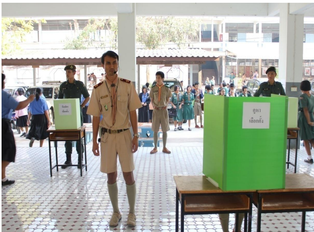
ครูประชาสัมพันธ์ขั้นตอนการเลือกตั้งประธานนักเรียน