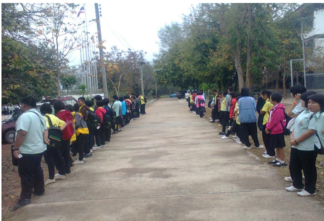
คณะกรรมการนักเรียนจะให้ให้นักเรียนที่มาสายยืนแถวหลังเสาธง และทำกิจกรรมบำเพ็ญประโยชน์