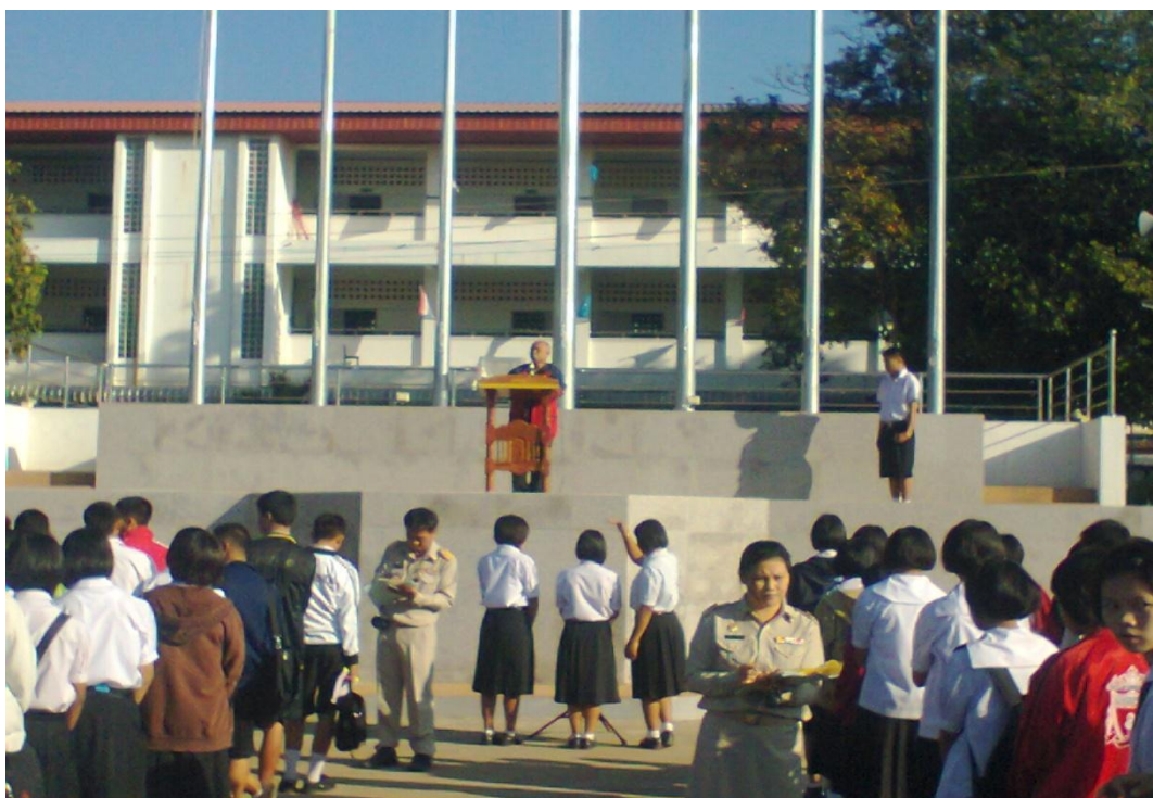
นักเรียนฟังการอบรมจากครูเวรประจำวัน และครูสำรวจรายชื่อนักเรียน ที่เข้าร่วมกิจกรรมหน้าเสาธงทุกวัน