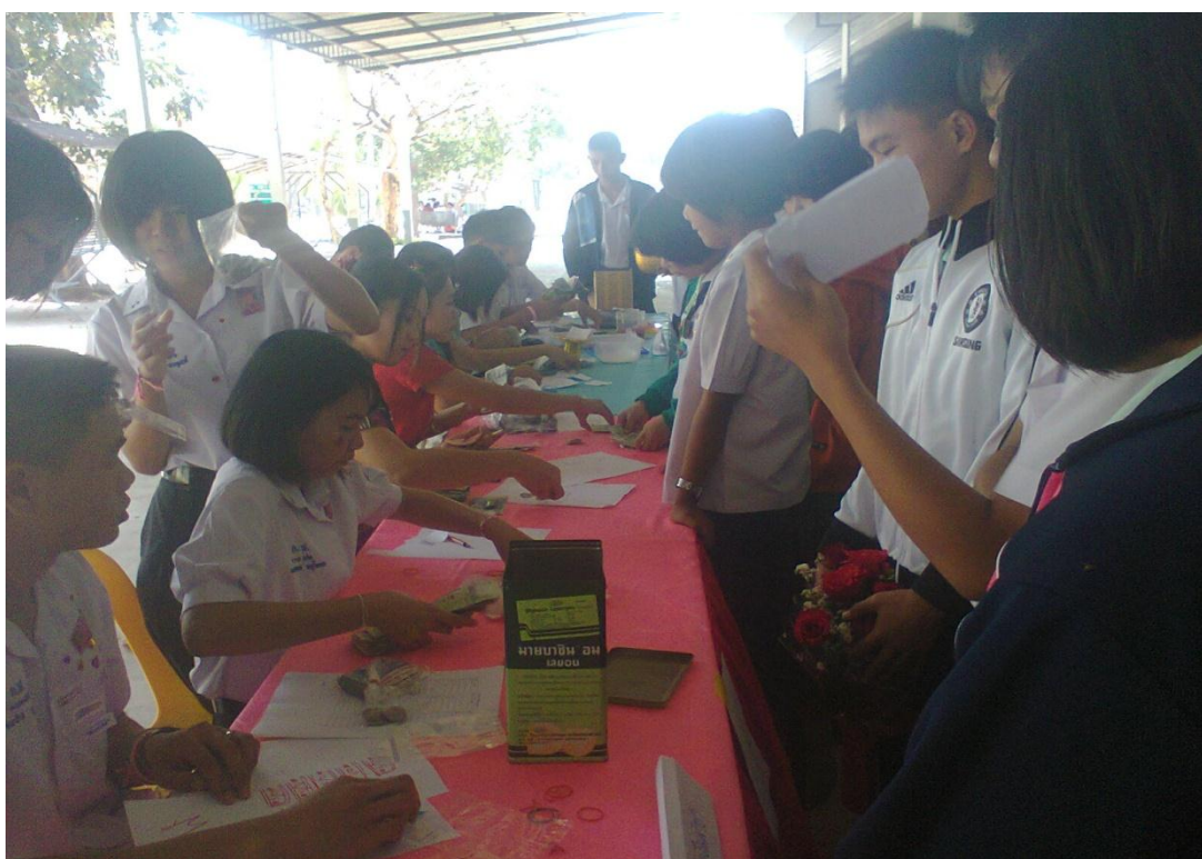
คณะกรรมการตรวจนับเงินผ้าป่าจากกองผ้าป่าของนักเรียนแต่ละห้อง