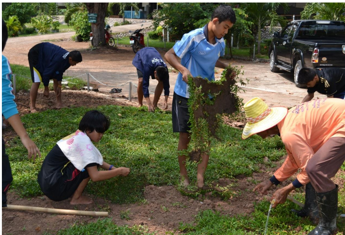
นักเรียนช่วยนักการปลูกหญ้าเพื่อจัดสวนหย่อมภายในโรงเรียน