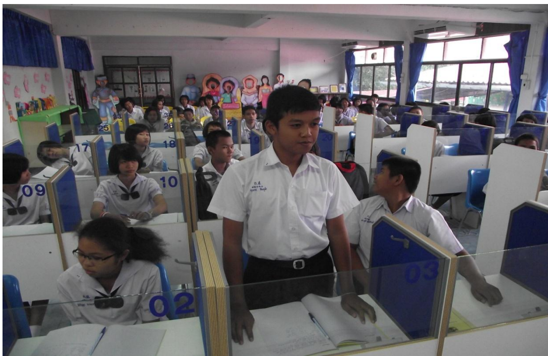
นักเรียนตั้งใจเรียนและซักถามครูเมื่อไม่เข้าใจในเนื้อหาบทเรียน