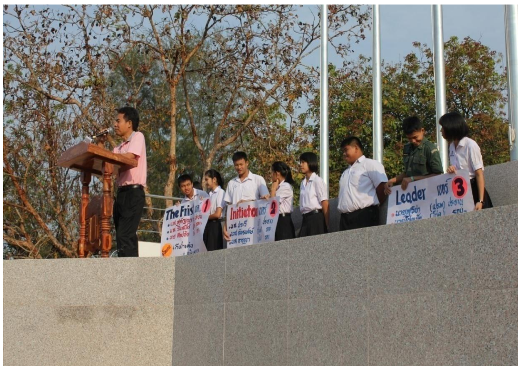
ผู้สมัครทั้ง 3 เบอร์ ขึ้นเวทีหน้าเสาธงเพื่อแนะนำตัว