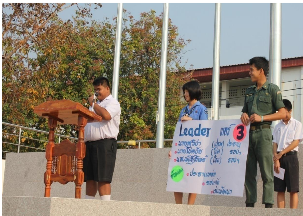
การหาเสียงของผู้สมัครประธานนักเรียนเบอร์ 3