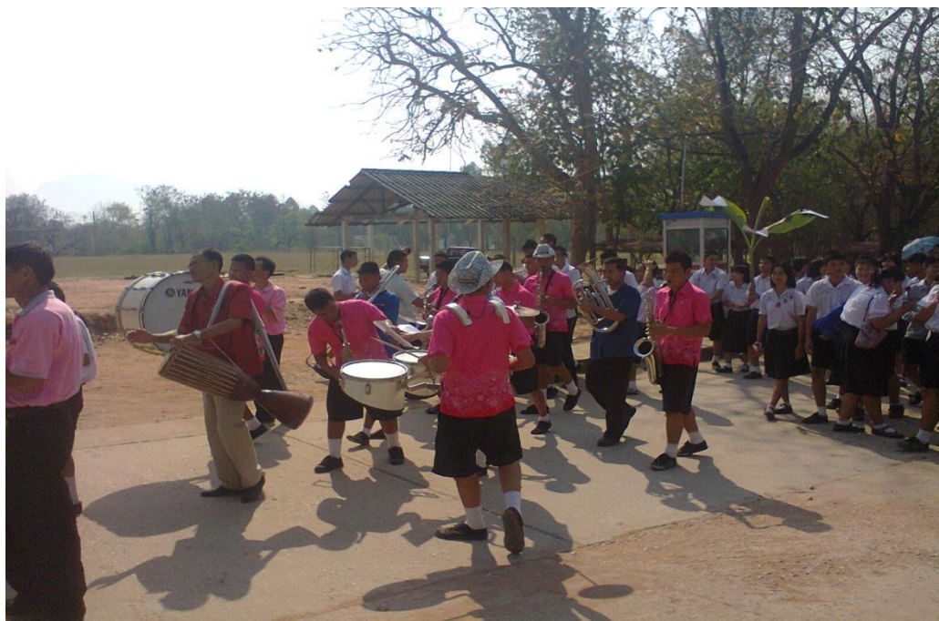
ขบวนกลองยาวและวงดุริยางค์นำขบวนแห่ต้นผ้าป่าวันรักโรงเรียน