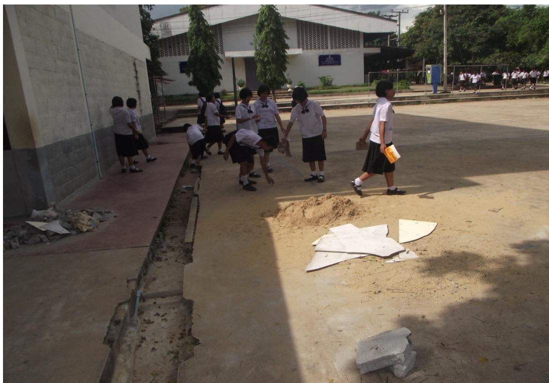
นักเรียนช่วยกันเดินเก็บขยะรอบบริเวณโรงเรียน