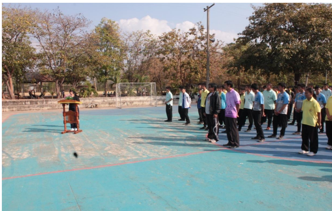
ท่านรองผู้อำนวยการฝ่ายบริหารกิจการนักเรียนกล่าวรายงานการจัดการแข่งขัน ต่อท่านประธาน