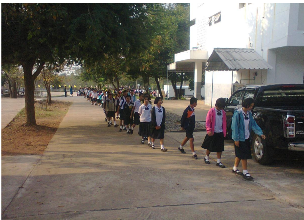
หลังจากกิจกรรมหน้าเสาธงนักเรียนเดินแถวขึ้นชั้นเรียนอย่างเป็นระเบียบ