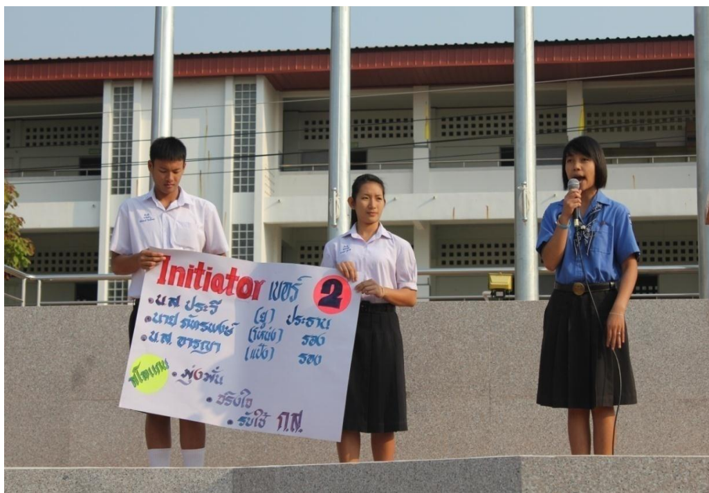
การหาเสียงของผู้สมัครประธานนักเรียนเบอร์ 2