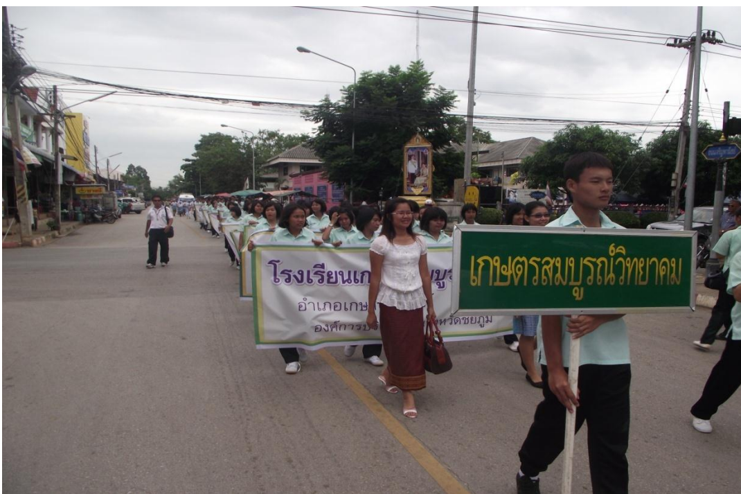
นักเรียนร่วมกิจกรรมเดินรณรงค์ต่อต้านยาเสพติดรอบอำเภอ