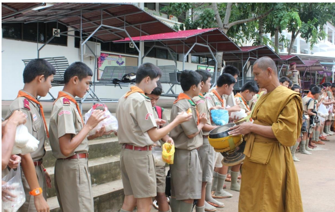
นักเรียนร่วมทำบุญตักบาตรข้าวสารอาหารแห้งในวันสำคัญทางพระพุทธศาสนา