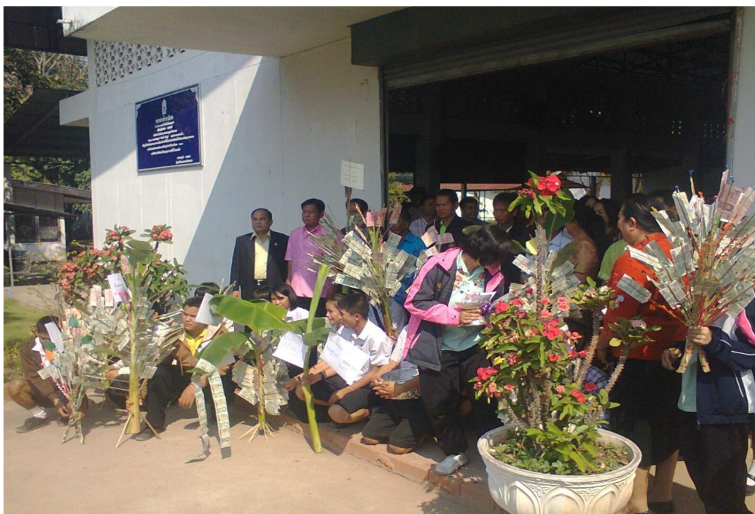
คณะผู้บริหาร คณะกรรมการสถานศึกษา สมาคมผู้ปกครองและครู ยื่นรอรับขบวนผ้าป่าวันรักโรงเรียนที่หอประชุม