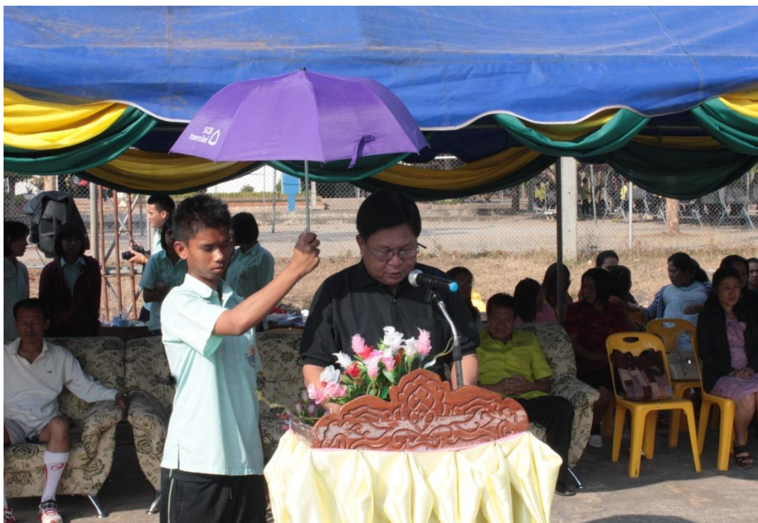
ท่านผู้อำนวยการโรงเรียนเป็นประธานเปิดกิจกรรมการแข่งขันฟุตบอล K.S. CUB