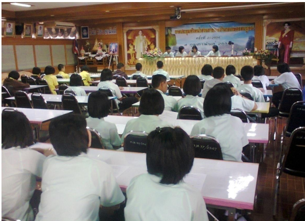
ประชุมสหภาพนักเรียนเพื่อรับทราบแนวทางการปฏิบัติในกิจกรรมเด็กดีวิถีประชาธิปไตย