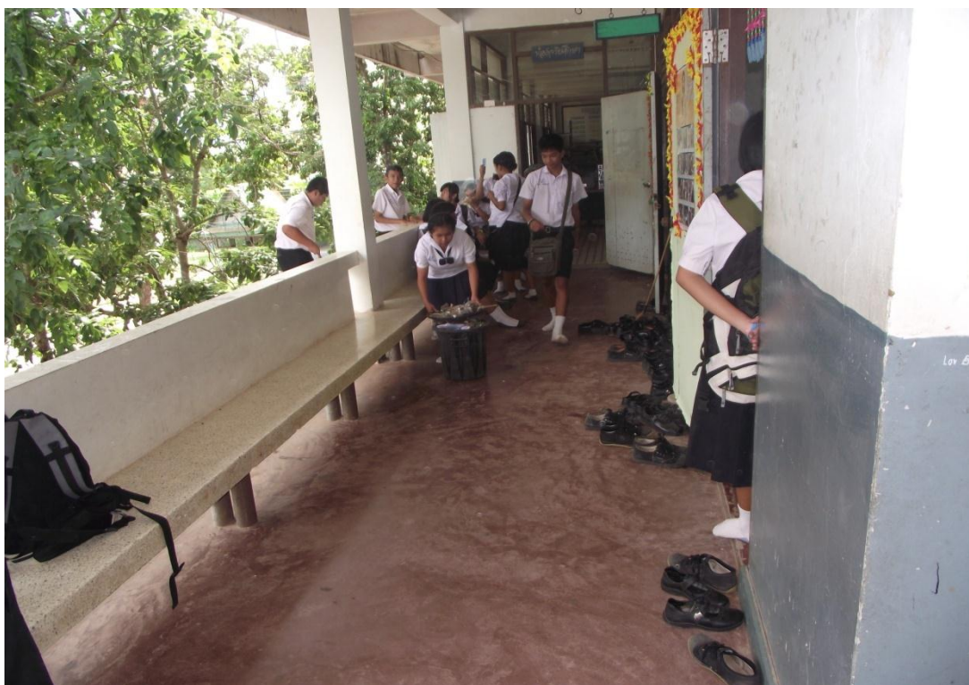
นักเรียนช่วยกันกวาดระเบียงและนำขยะใส่ถังขยะเพื่อนำไปเทที่เตาเผา