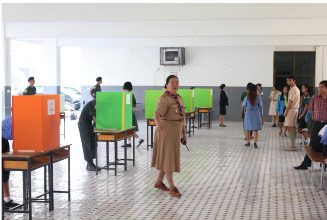
คณะครูและคณะกรรมการสังเกตการณ์บริเวณคูหาเลือกตั้งประธานนักเรียน