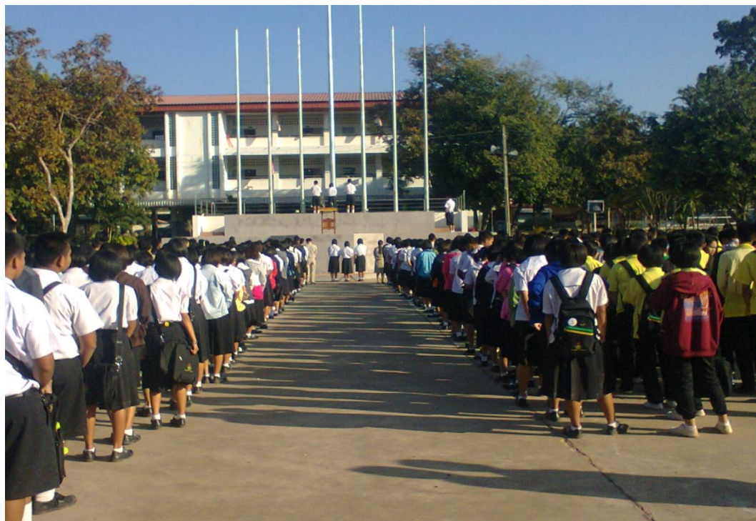
นักเรียนร่วมกันสวดมนต์ไหว้พระ แม่เมตตา และสงบนิ่ง