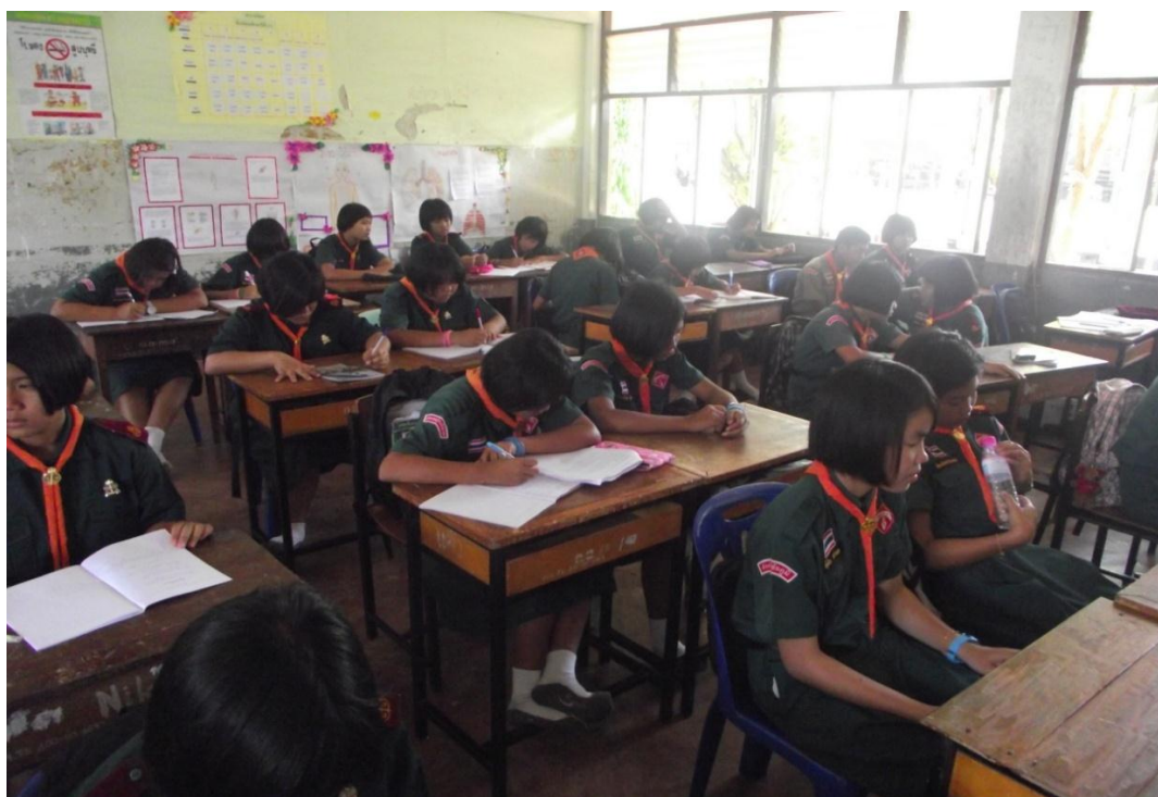
นักเรียนเข้าชั้นเรียนและนั่งรอคุณครูโดยพร้อมเพรียงกัน