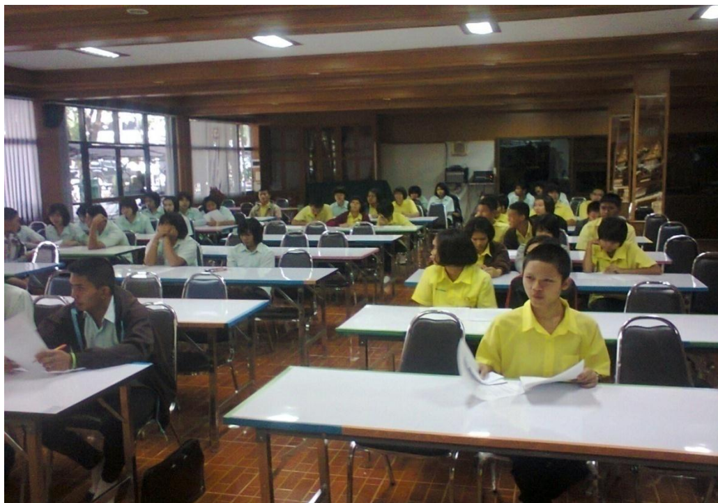
หัวหน้าห้องรับแนวทางการปฏิบัติกิจกรรมจากการประชุมสหภาพนักเรียน ไปประชาสัมพันธ์ให้สมาชิกในห้องทราบ