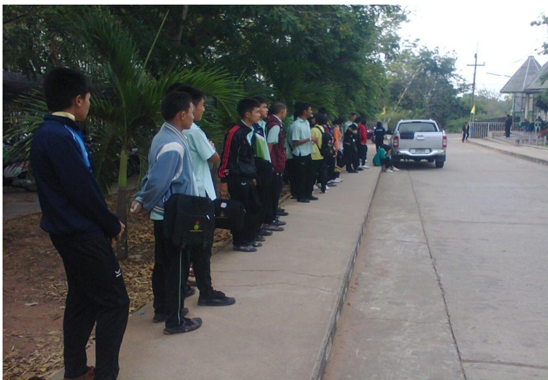
นักเรียนที่มาสายคณะกรรมการนักเรียนจะให้บันทึกการมาสายหน้าประตูโรงเรียน