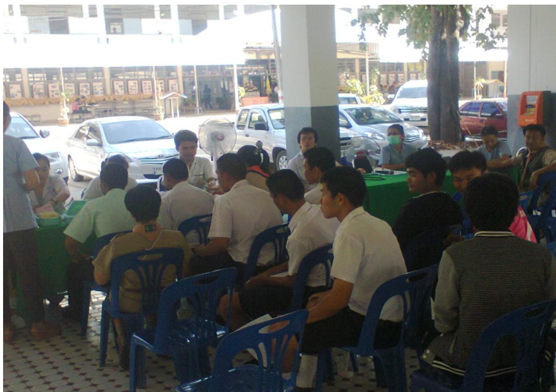
นักเรียนเข้าแถวรอวัดความดันเพื่อบริจาคโลหิต