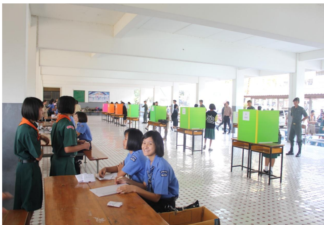
ภาพการปฏิบัติหน้าที่ของคณะกรรมการเลือกตั้งประธานนักเรียน