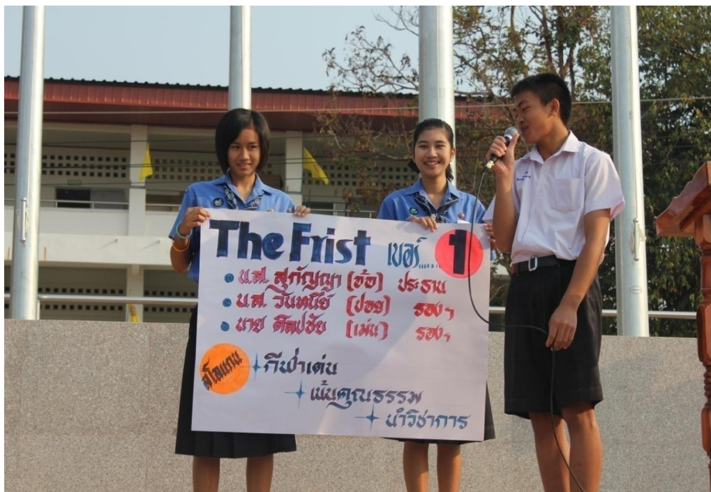
การหาเสียงของผู้สมัครประธานนักเรียนเบอร์ 1