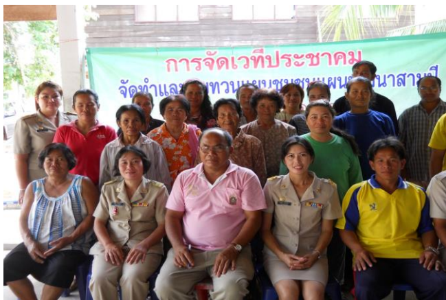
ภาพประชุมชี้แจง/รับฟังความคิดเห็นของประชาชน